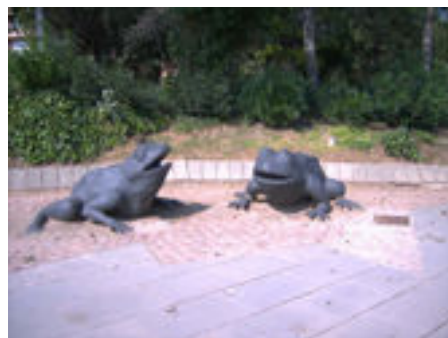
Samen in de zandbak

Ik ben een alleenstaande vrouw niet rokend, die een wandelmaatje zoekt voor wandelingen van 1 tot 3 uur. Een kopje koffie tussendoor zou ook gezellig zijn. Verder is mijn hobby muziek maken en ik zoek 'n muzikant om mee samen te spelen, liefst een snaar-instrument. Speel zelf piano. Heb je vragen over deze dingen bel dan even, zou leuk zijn als we samen iets konden doen. (200902)