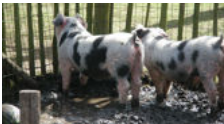
Samen in de modder