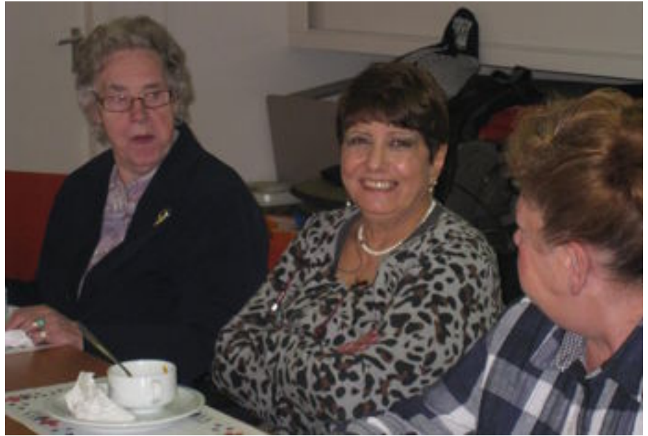
Bijeenkomst 8 november 2011

In het vorige nummer staat wel ons bankrekeningnummer maar niet het bedrag dat we graag willen hebben. Dat bedrag is € 7,00 voor een heel jaar. Wie voor 2011 nog niet betaald heeft wordt verzocht dat alsnog te doen. De contributie blijft in 2012 ongewijzigd ondanks de inflatie en een mooier blad. Wij blijven bereikbaar op telefoonnummer 026 323 28 74 op dinsdag- en donderdagochtend van 10.00 tot 12.00 uur. Op andere dagen en tijden kunt u een bericht inspreken op het antwoordapparaat.