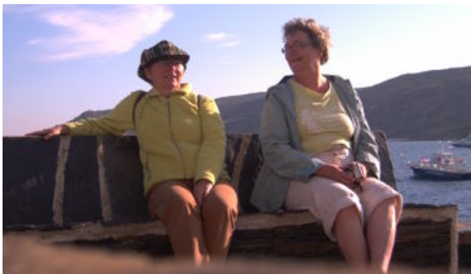
Samen in de zon