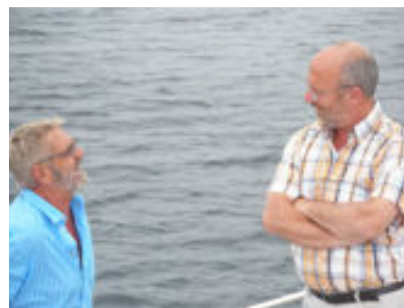
Samen er op uit

Wie heeft belangstelling om te wandelen of te fietsen in een groepje, op dinsdag, donderdag of zaterdag. Bijvoorbeeld eens in de 14 dagen. Ik ben een man en mijn voorkeur gaat uit naar een groepje, hetgeen het contact mogelijk wat gemakkelijker maakt. Ik wacht met belangstelling uw reactie af. (200956)